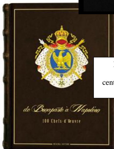
De Bonaparte à Napoléon, cent Chefs-d'Oeuvre (70 x 50 cm)