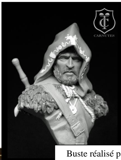
Buste réalisé par Les Carnutes : Greg Girault, Florent Desmerger