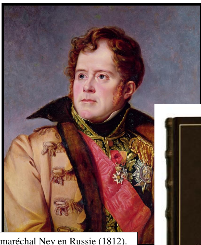
Le maréchal Ney en Russie (1812). Le buste offert, sera largement inspiré du tableau ci-dessus.